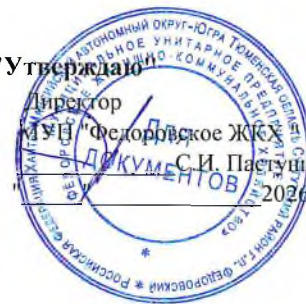
График промывки сетей водоотведения МУП "Федоровское ЖКХ" на 2026 год